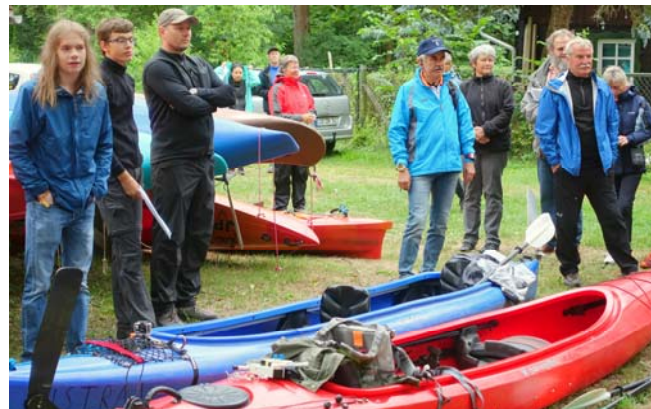
Bild 4: Gespanntes Lauschen bei Bekanntgabe der Sonderaufgabe der SWFJ 2018

Das weitverzweigte Kanalsystem der Spree erfordert ein aufmerksames Kartenstudium. Erschwerend kam hinzu, dass mitten im Wettkampfgelände die Hauptspreewald auf Grund von Brückenbauarbeiten unbefahrbar war. Eine Schleuse musste umtragen werden.